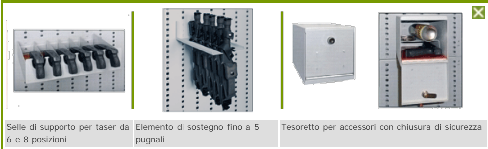
Selle di supporto per taser da 6 e 8 posizioni