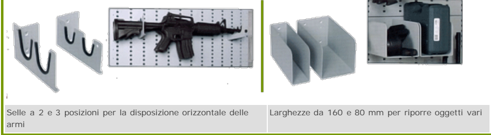
Selle a 2 e 3 posizioni per la disposizione orizzontale delle armi