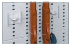
Asole di sicurezza con cavo di sostegno