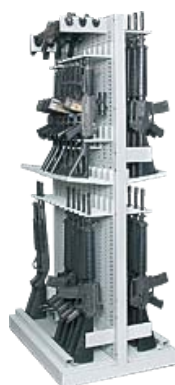
Rastrelliera doppia faccia, modulo base