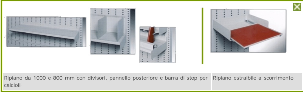
Ripiano da 1000 e 800 mm con divisori, pannello posteriore e barra di stop per calcioli