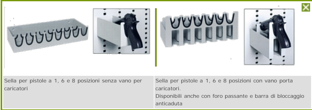
Sella per pistole a 1, 6 e 8 posizioni senza vano per caricatori