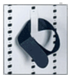
Supporto con velcro per fucili tradizionali