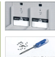
Targhette porta nome