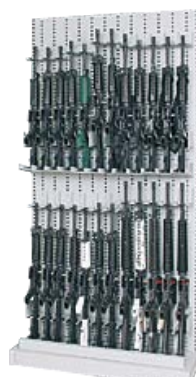
Rastrelliera singola faccia, modulo base

L'ampia gamma di componenti di supporto, permette di configurare la rastrelliera in funzione di ogni necessità operativa.