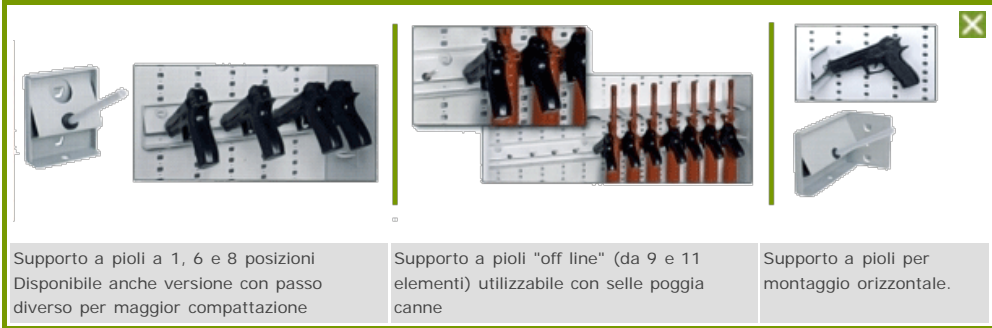
Supporto a pioli a 1, 6 e 8 posizioni. Disponibile anche versione con passo diverso per maggior compattazione